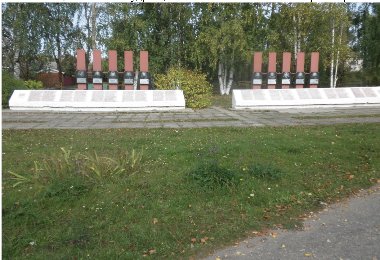
Фото общественной территории: Архангельская область, Шенкурский район, г. Шенкурск, Сквер 50-летия Победы между улицами Мира, Ломоносова, Кудрявцева и Красноармейская